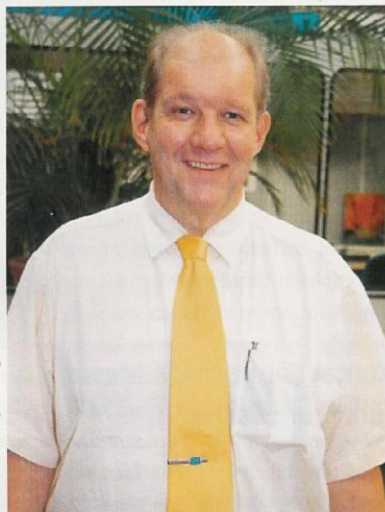
Bild: Der Facility Manager

FaciPlan wird jedoch nicht nur als Zeichentool eingesetzt. Die im Plan zu den jeweiligen Maschinen hinterlegten Daten enthalten nicht nur die Maßangaben und die Fabrikatsbezeichnung, sondern auch die Anschlussleistung in kW und die notwendige Absicherung in Ampere. „Dadurch erkennen wir in der Planphase auf einen Blick, ob die